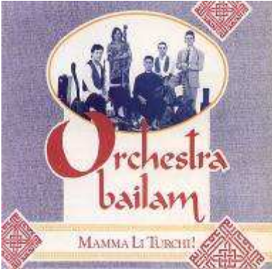
“Mamma li Turchi”- SudNord 1991