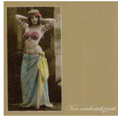
“Non Occidentalizzarti” - Felmay 2006

“La storia dell’Orchestra Bailam si misura si sul crinale comunque rilevante della tenuta cronologica (e loro esistono da 13 anni), ma soprattutto è vicenda quotidiana e occasioni di festa, incontri, concerti, approfondimenti strumentali, ascolti indefessi e voraci, una sorta di attitudine ragionata alla bulimia sonora del Mediterraneo che li ha portati a girovagare qua e là a caccia di tracce, di strumenti e maestri. Storia di chilometri, quindi: di pulmini da stipare con uno strumentario che sembra il riassunto di quanto è accaduto in musica nel l’ultimo millennio fra una sponda e l’altra del piccolo mare delle civiltà, storia di spettacoli che hanno costruito, anch’essi, una storia scintillante di simpatia.